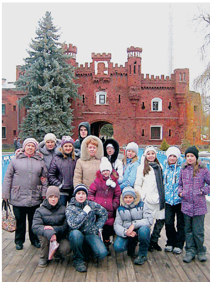
Затем мы посетили Музей дикой природы. Очень необыч-

Мы с удовольствием покормили их хлебушком, который прихватили с собой с обеда.