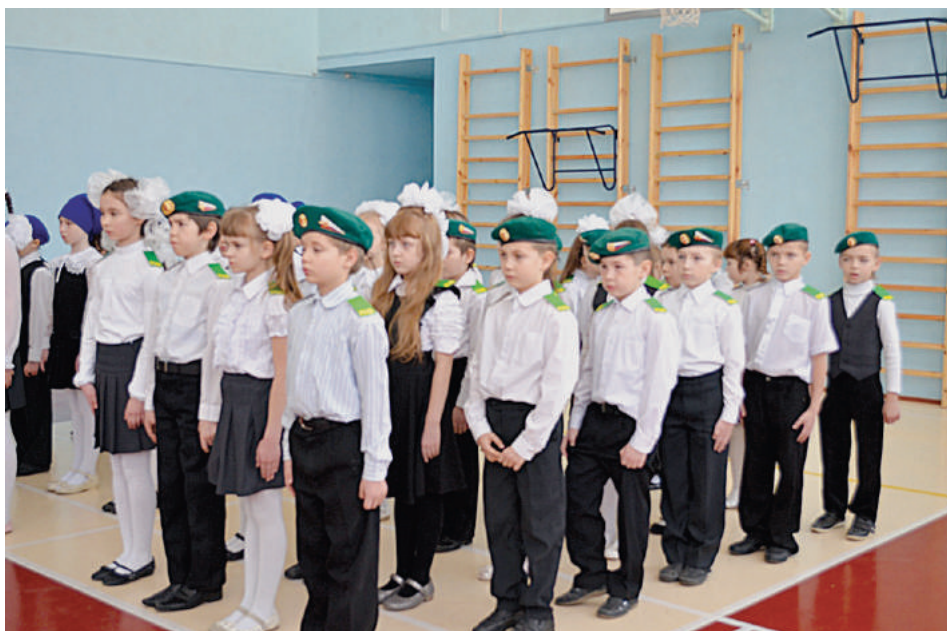
Школьный смотр песни и строя.