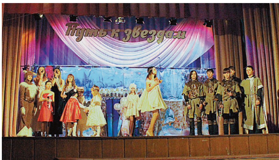
На «Пути к звездам».