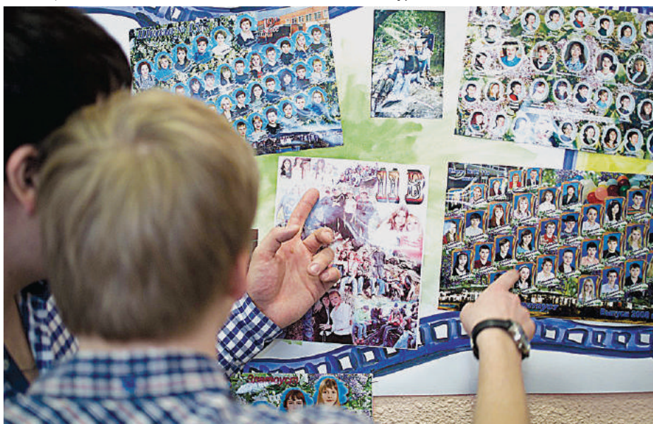
Вечер встречи выпускников.