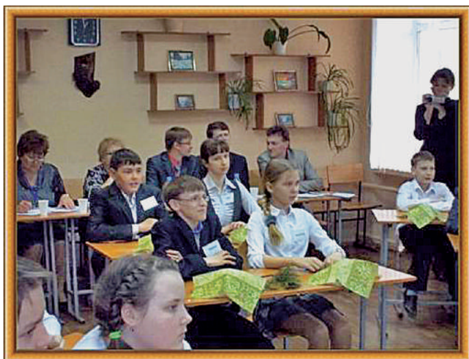
Конкурс «Сердце отдаю детям».