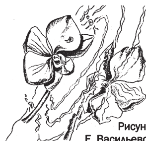
Рисунок Е. Васильевой.