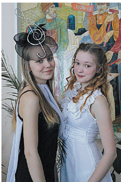
На «Пути к звездам».