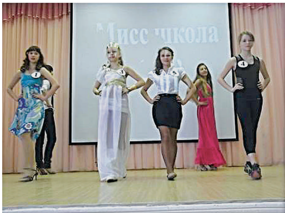
Конкурс «Мисс Весна».