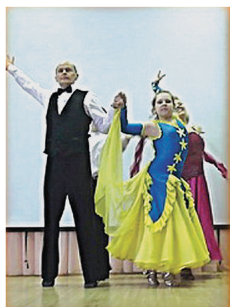
Конкурс «Мисс Весна».