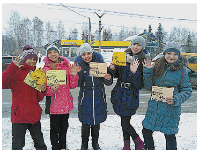
Профилактическая акция ЮИД «Весенние каникулы».